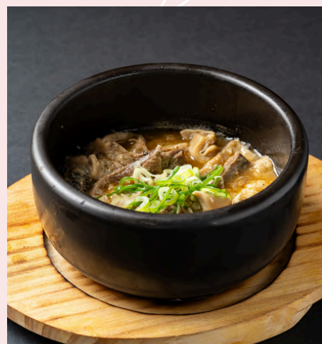
牛すじとモツ煮込み 1,680円