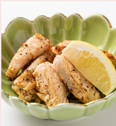
やげんなんこつ 880円