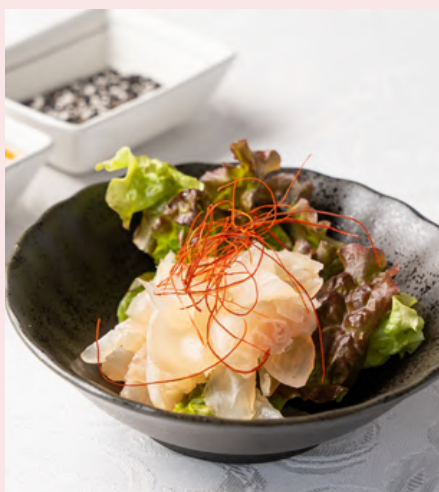
牛アキレスのボイル 770円