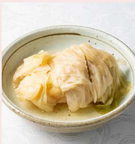
ハルピンキャベツ 750円