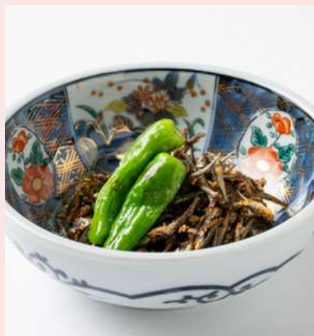
韓国風じゃこ炒め 620円