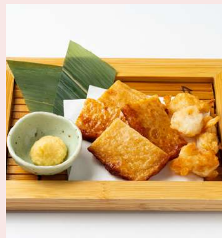
福岡の揚げ蒲鉾 900円