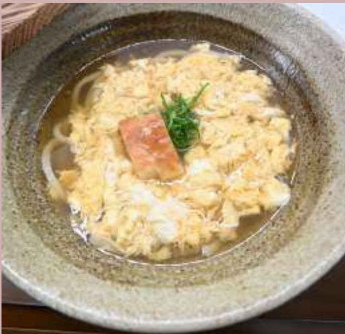
たまごとじうどん