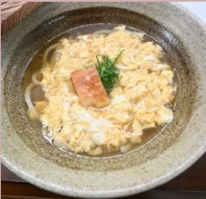
たまごとじうどん